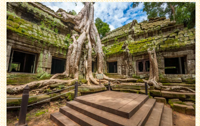
木々が遺跡に絡みつく景観が圧巻の タ・ブローム（イメージ）

※上記スケジュールは2023年11月30日時点の予定のものです。今後、交通機関や現地事情により内容が変更となる場合が あります。