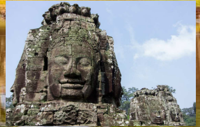
アンコールトムの観世音菩薩（イメージ）

旅行期間：2024年3月14日（木）～3月18日（月）5日間 旅行代金：お1人様 2名1室 248,000円 1名1室 288,000円