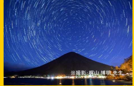
※撮影: 梶山 博明 先生